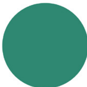
مشاور عالی طرح