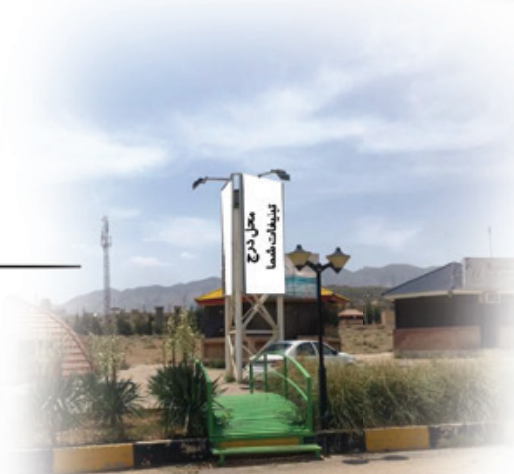
محل درج تبلیغات شما