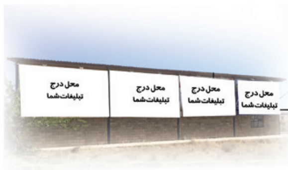
اختصاص بیلبردهای تبلیغاتی در پارکینگ شماره ۱