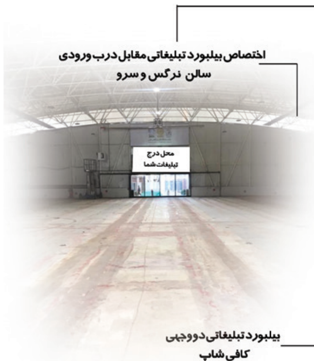
اختصاص بیلبرد تبلیغاتی مقابل درب ورودی سالن نرگس و سرو