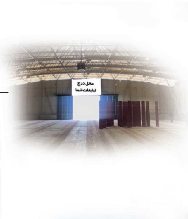
محل درج تبلیغات شما